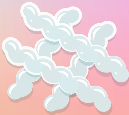
水溶性の食物繊維 (イソマルトデキストリン)